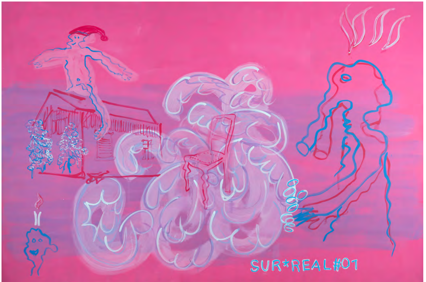
SUR*REAL#01 , 2025 Acryl auf Leinwand 190 x 295 cm