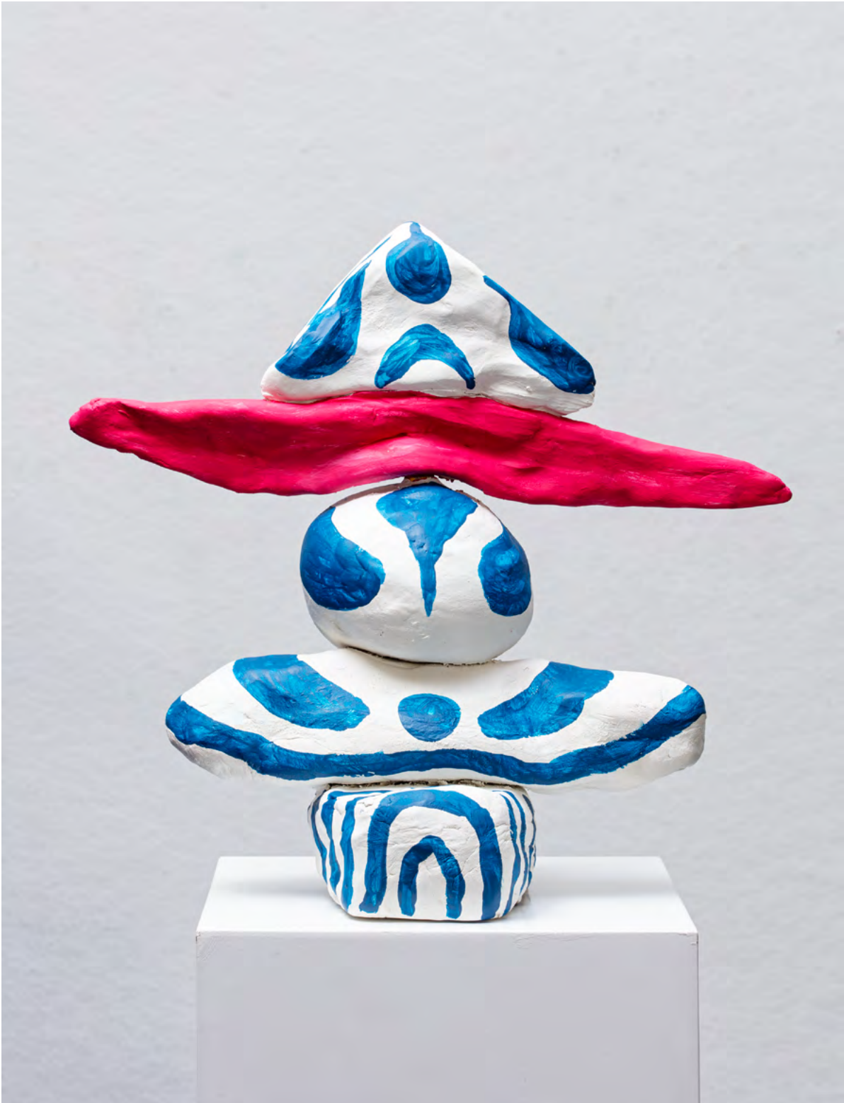
KRAFT-TIERE , 2024 Skulptur aus Modelliermasse 33 x 34 x 15 cm