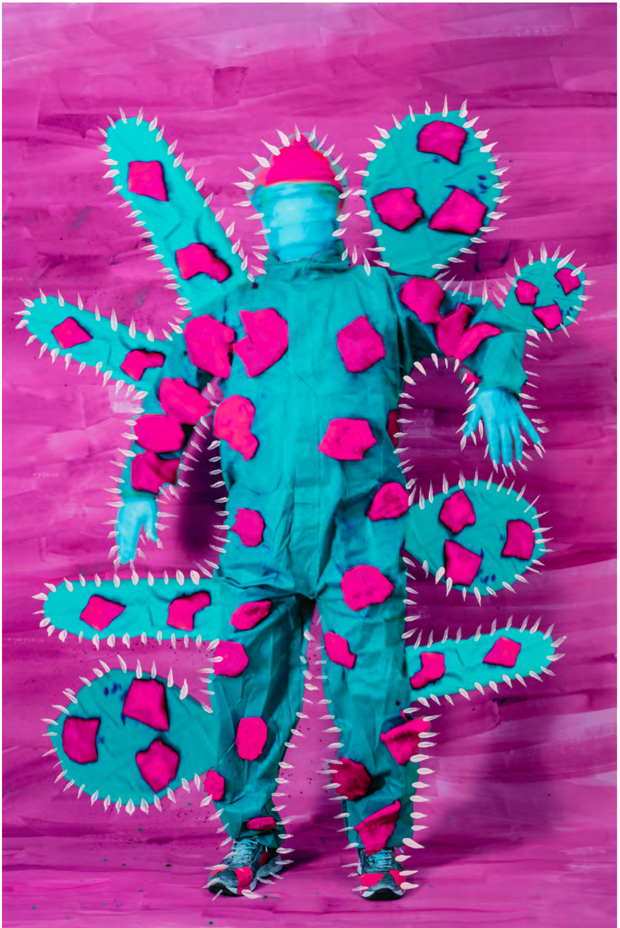
LIKE A PLANT , 2024 Malerei auf Fotografie (Pigmentdruck) Masse variabel