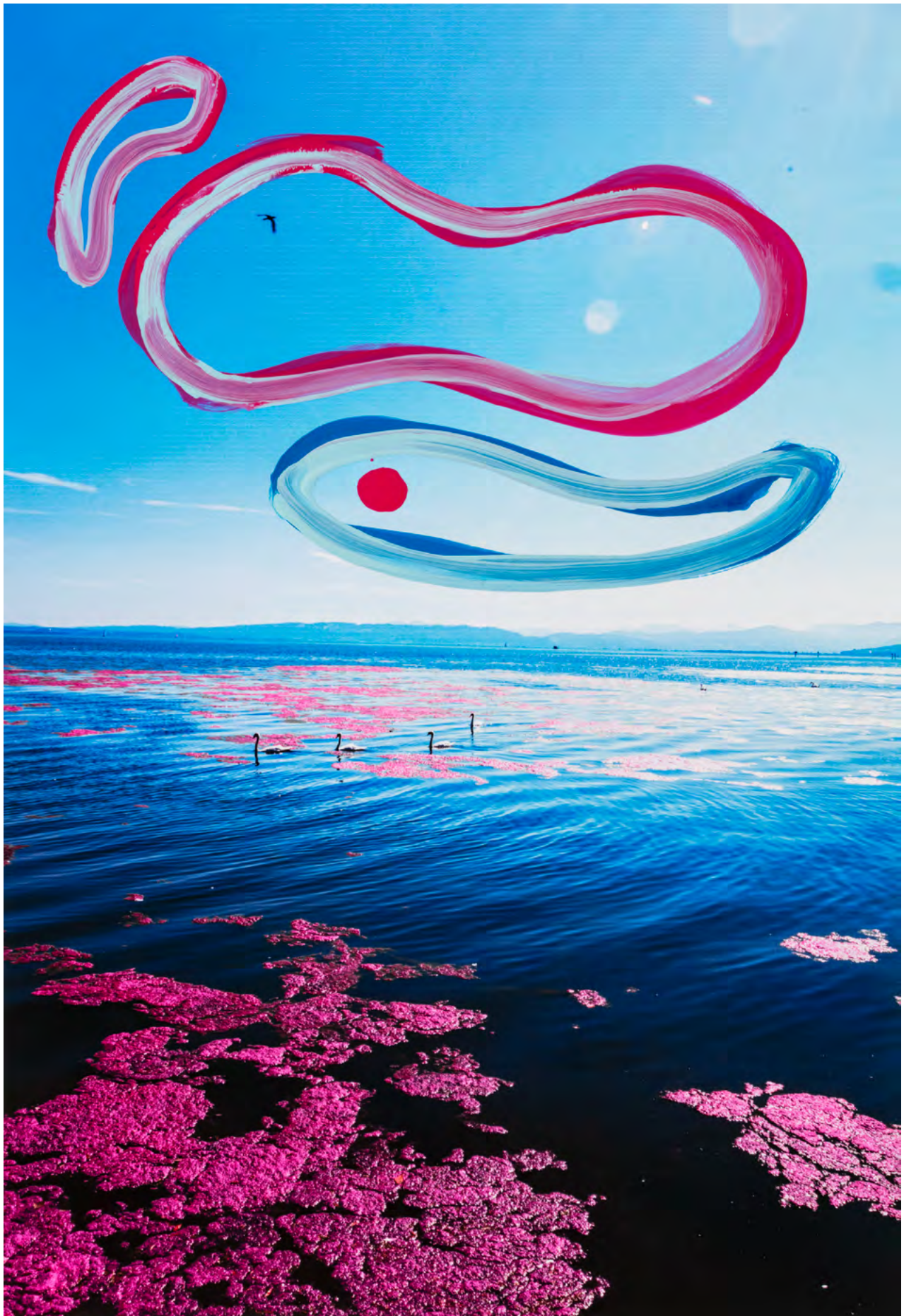
BOUNDLESS , 2024 Malerei auf Fotografie (Pigmentdruck) Masse variabel