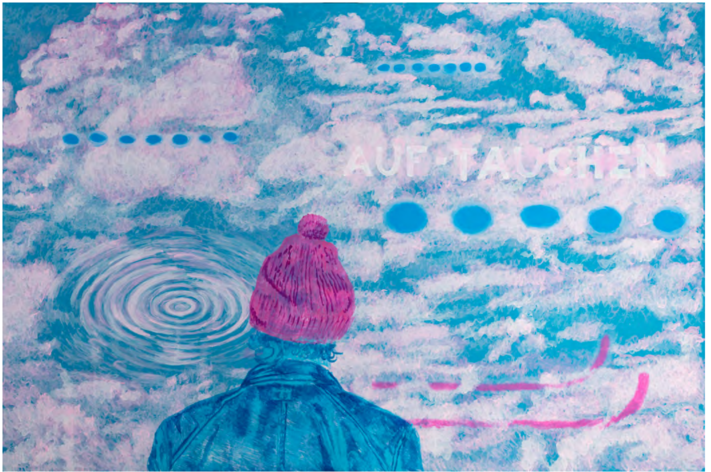
AUF-TAUCHEN , 2024 Acryl auf Leinwand 160 x 240 cm