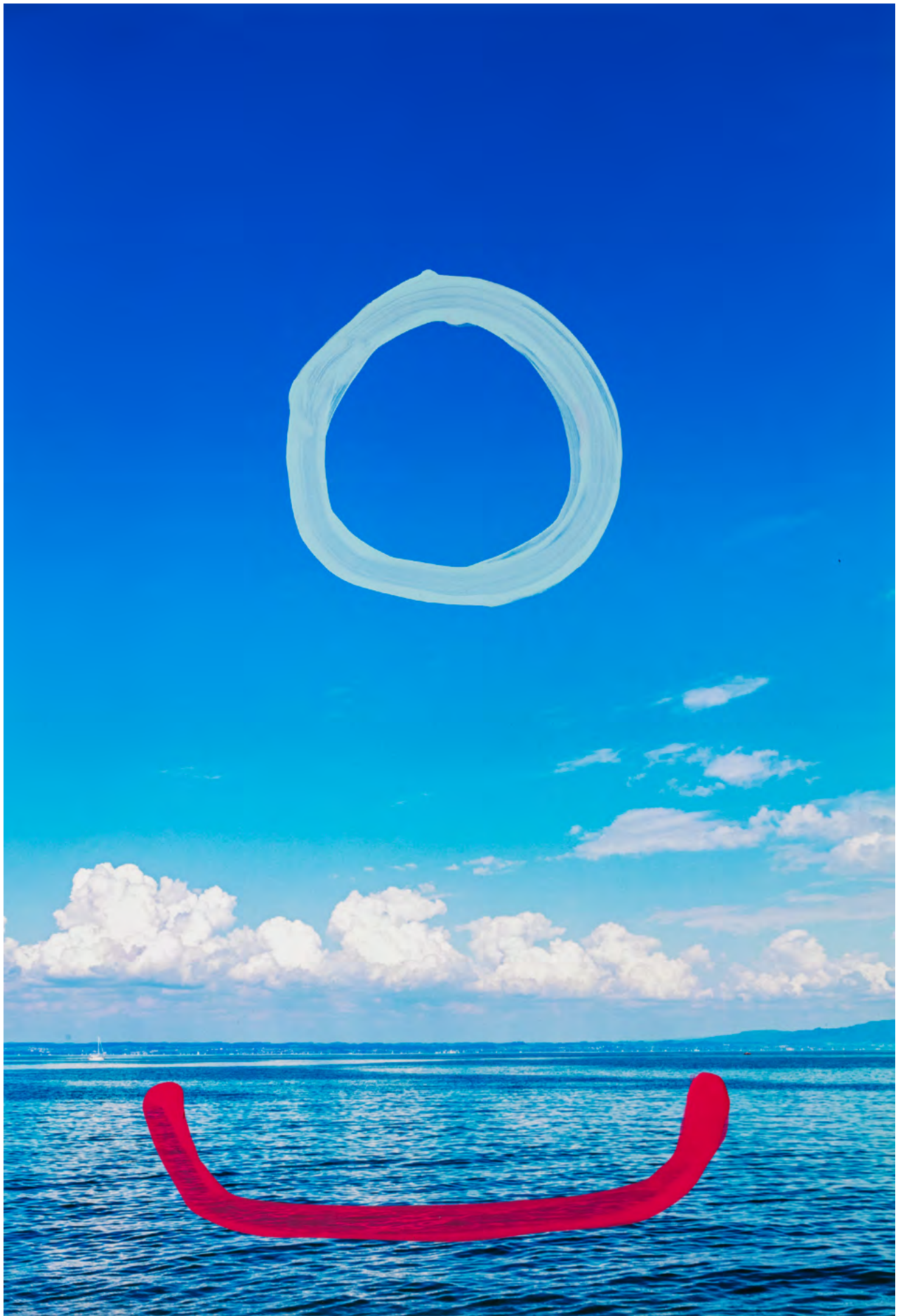
ANCESTRAL JOURNEY, 2024 Malerei auf Fotografie (Pigmentdruck) Masse variabel