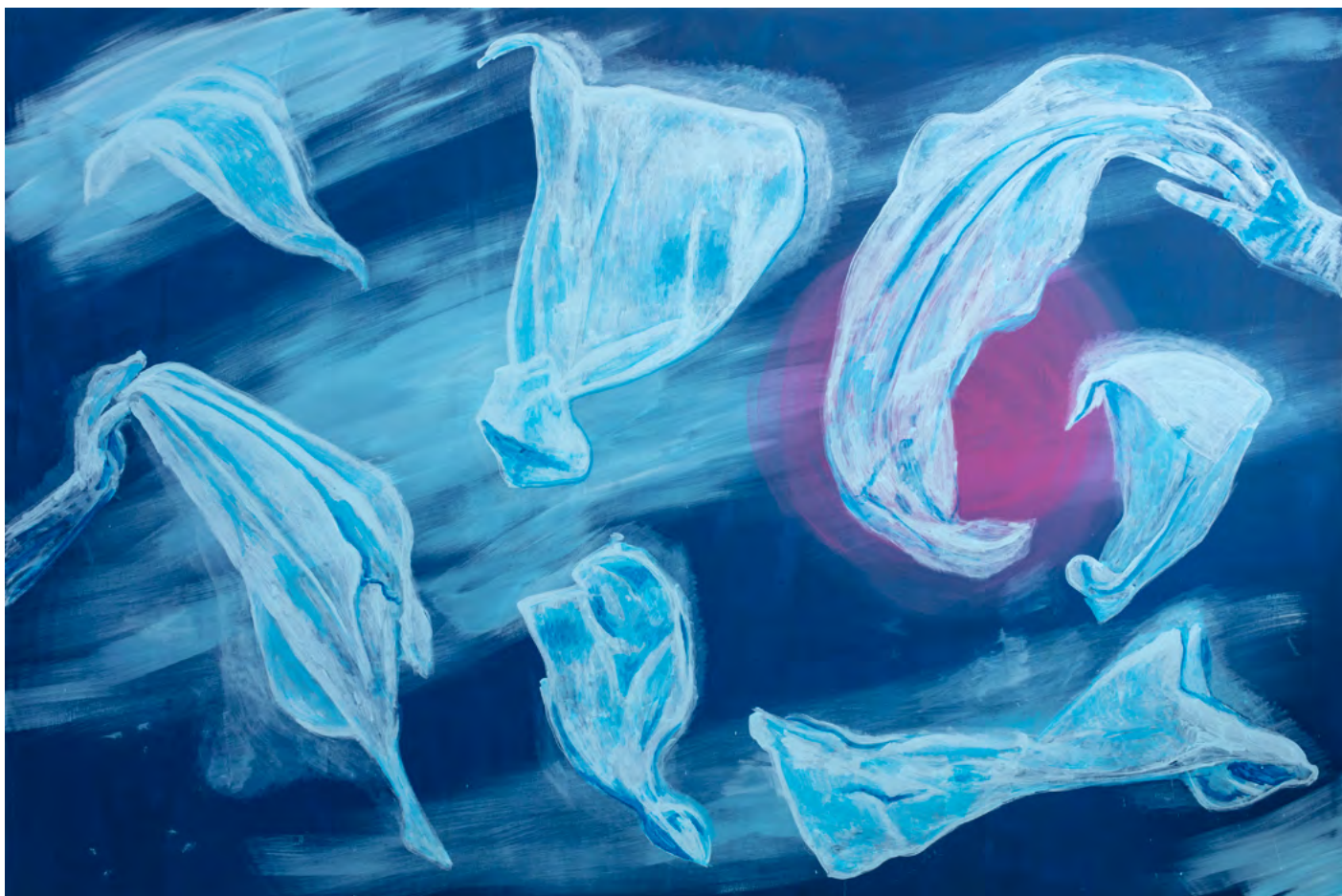
LEARNING TO FLY, 2024 Acryl auf Leinwand 160 x 240 cm