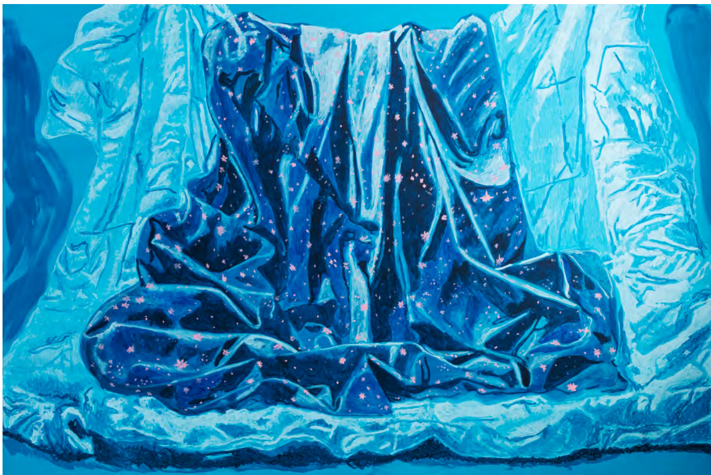
STERNEN-MANTEL , 2024 Acryl auf Leinwand 160 x 240 cm