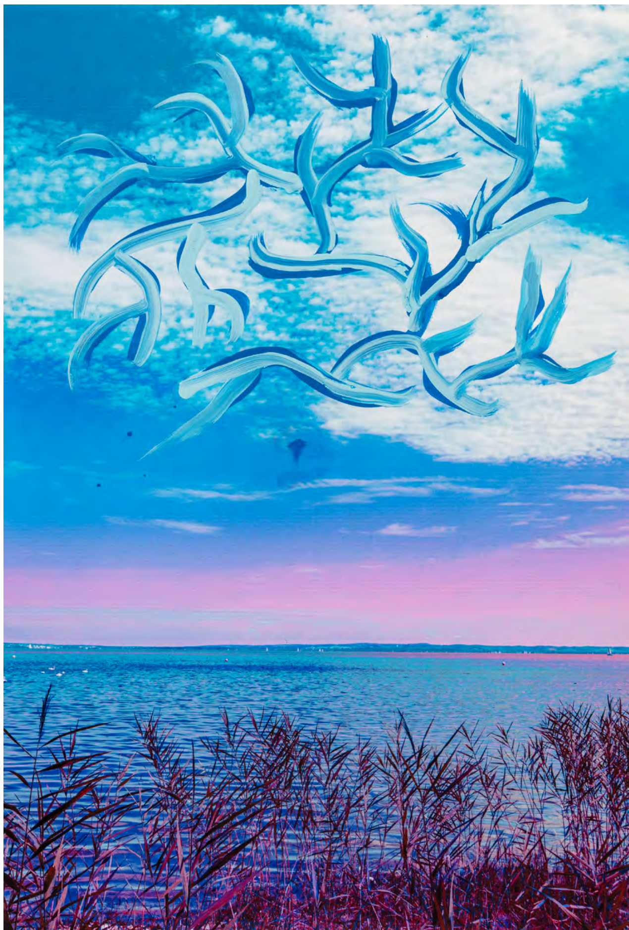
CLOUDY VIEW, 2024 Malerei auf Fotografie (Pigmentdruck) Masse variabel