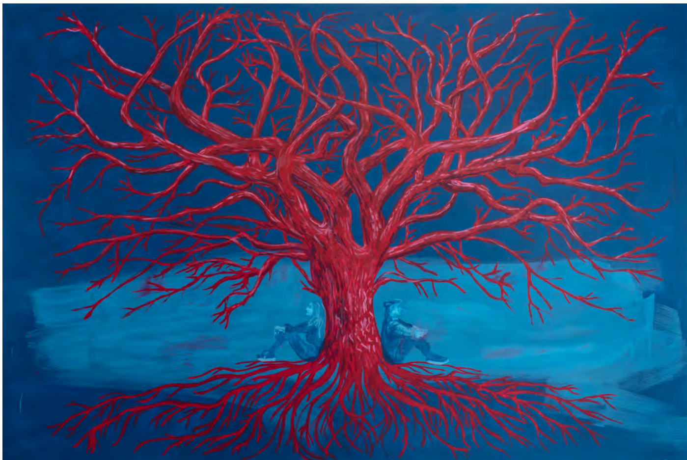
GATHER ENERGY , 2024 Acryl auf Leinwand 160 x 240 cm