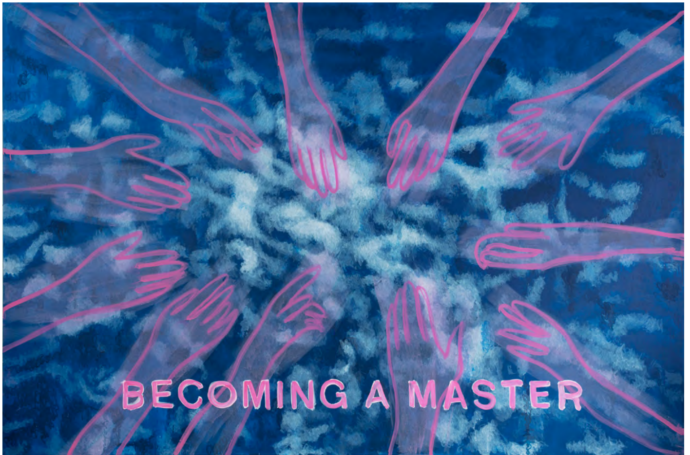
BECOMIN A MASTER , 2025 Acryl auf Leinwand 190 x 295 cm