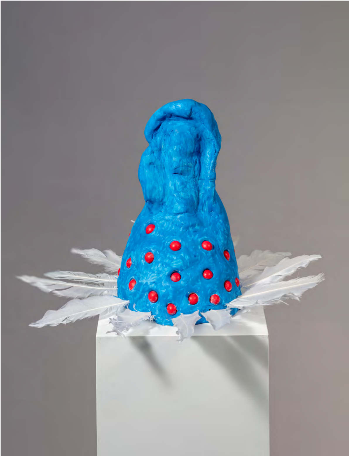
(K)-EINE AHNUNG, 2024 Skulptur aus Modelliermasse 29 x 41 x 41 cm