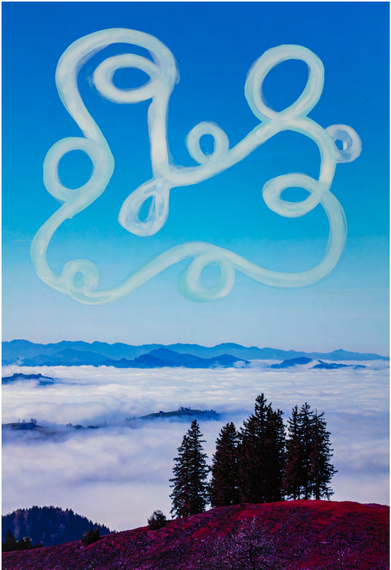
UPSTAIRS , 2024 Malerei auf Fotografie (Pigmentdruck) Masse variabel