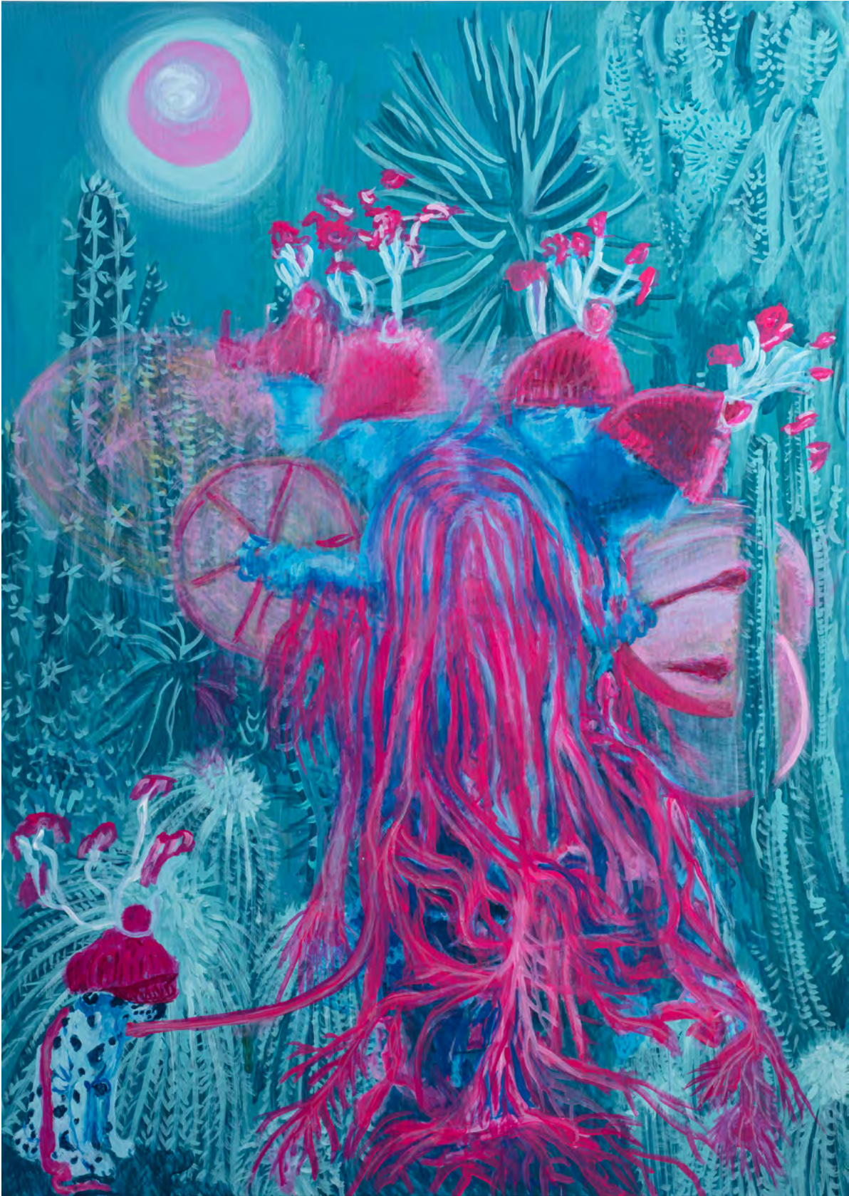
LIKE A SHAMAN , 2024 Acryl auf Leinwand 140 x 100 cm